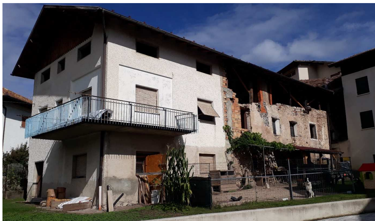
Vista da sud