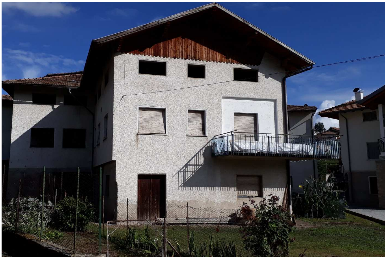
Vista da ovest